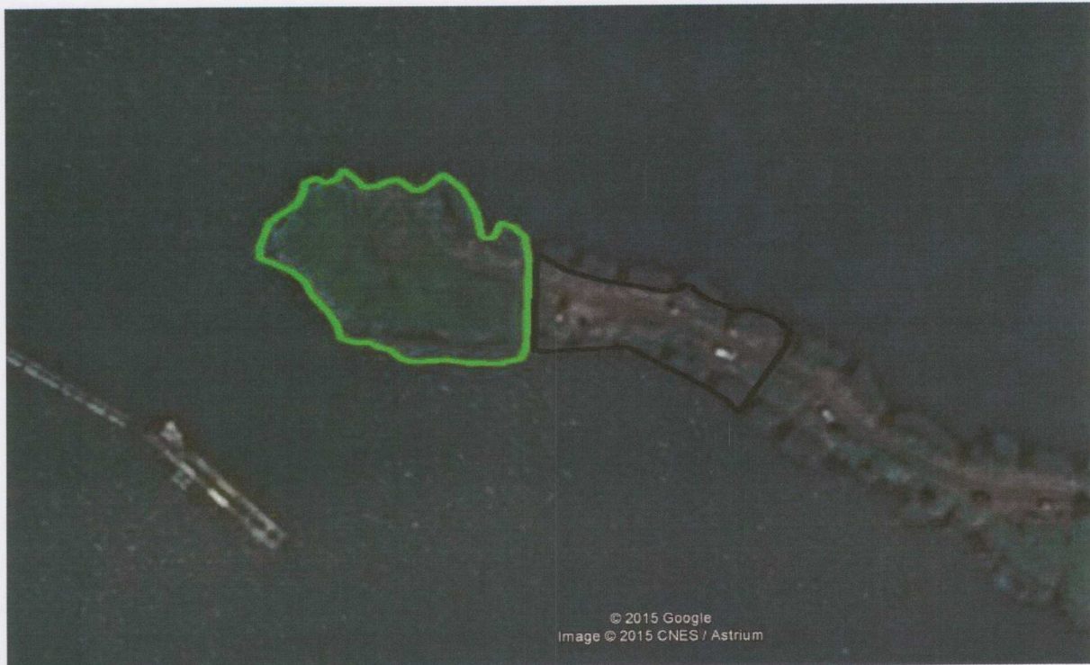
Rycina 5. Utworzenie nowej wyspy.