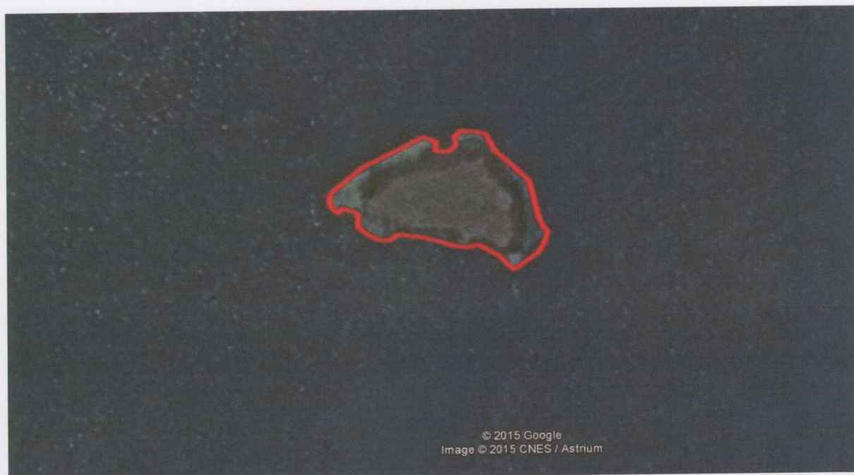
Rycina 4. Utrzymanie otwartego charakteru wyspy.