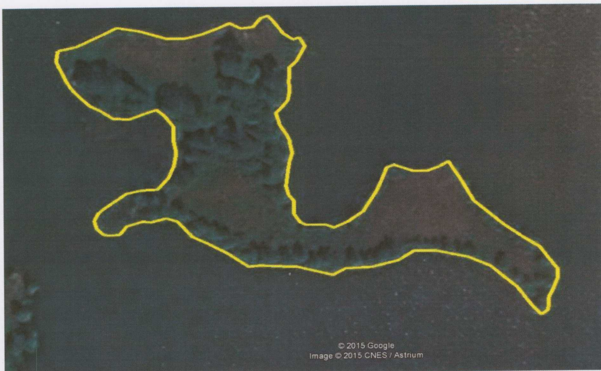
Rycina 3. Odtworzenie otwartego charakteru wyspy.

ul. Hallera 35/2, 87-100 Toruń adres korespondencyjny: ul. Bydgoska 1, 87-100 Toruń www.alauda.org.pl; tp@alauda.org.pl REGON: 340884151, NIP: 8792650892, KRS: 0000380495